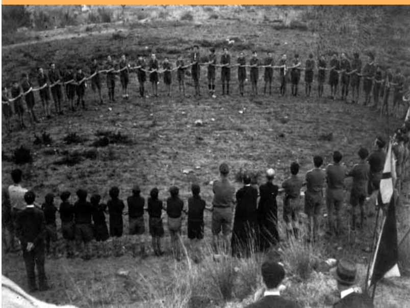
Rotllana durant uns campament vora l'any 1931

Dues de les cares més conegudes de l'escoltisme català