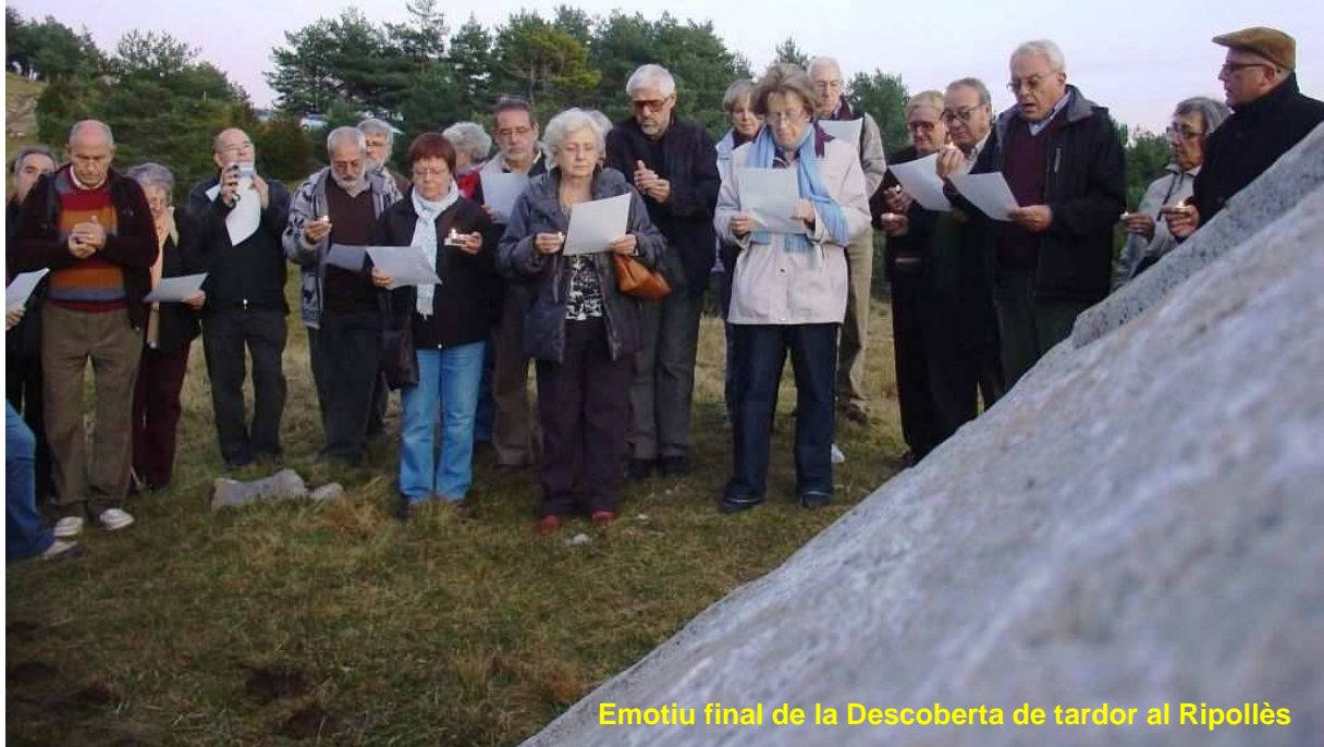
Emotiu final de la Descoberta de tardor al Ripollès