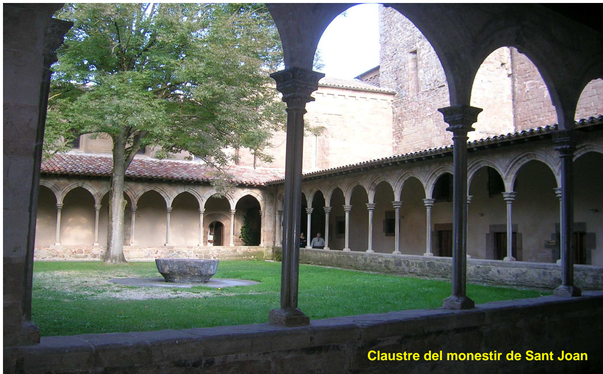
Claustre del monestir de Sant Joan

El monestir fou fundat l'any 887 pel comte Guifré el Pelós i la seva muller Guinedilda, per tal que fos el lloc de formació de la seva filla Emma. Les monges van ser expulsades en l'any 1017. Amb posterioritat, entrà a formar part de la llegenda del Comte Arnau, que fa pocs mesos ha estat ben recollida en dos audiovisuals que vàrem poder veure en el restaurat Palau de l'Abadia contigu al monestir. De l'església destaquem la bellesa de les imatges que constitueix el grup escultòric del davallament, usualment anomenat "El Santíssim Misteri" per haver conservat al front del Crist una sagrada hòstia durant set segles. És un conjunt de gran qualitat i l'únic del seu tipus que s'ha conservat al lloc original.