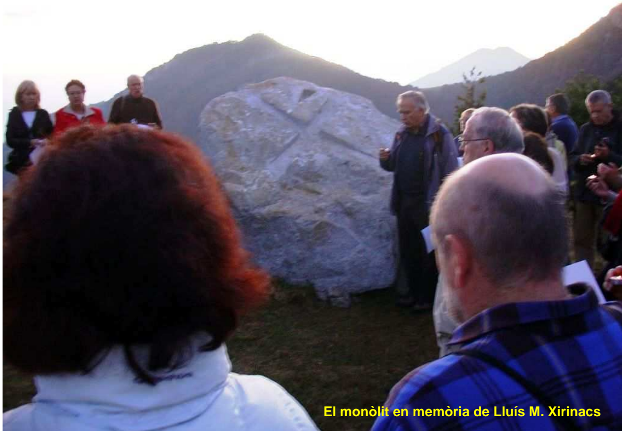
El monòlit en memòria de Lluís M. Xirinacs

Ja curts de claror, per la caiguda de la tarda, però amb una magnífica posta de sol, arribem al paratge de la Tuta del Pla de Can Pegot, per recordar la figura del patriota, ex-consiliari escolta Lluís Maria Xirinacs, al lloc on va morir l'agost de 2.007. Aquest indret, on s'hi ha col·locat un monòlit en la seva memòria, ha esdevingut una mena de "quilòmetre zero" cap a la independència de Catalunya.