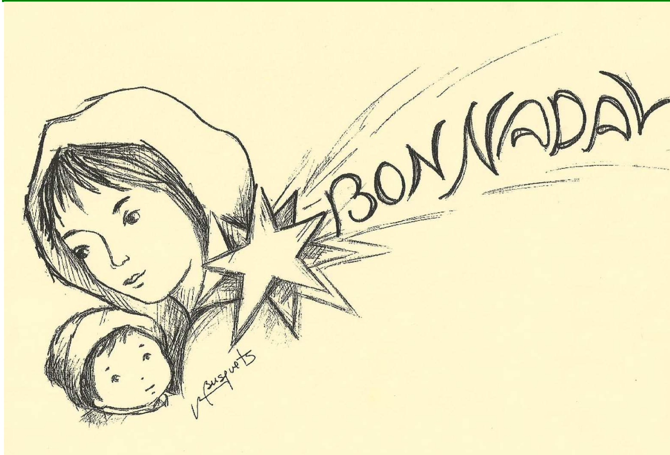
Dibuix: Roser Busquets

Ens omplim la boca de cants de bressol: l'infant del pessebre és l'esclat d'un sol que va il·luminant nostre goig de viure