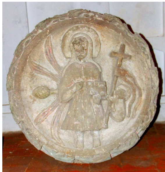
Clau de volta de la basílica de Sta. Maria

També va ser molt interessant poder veure de prop, restaurada, la Lauda Sepulcral, just recentment restaurada i testimoni que