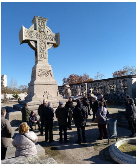
La creu en memòria de les víctimes de l'epidèmia de còlera de 1821.

No gaire lluny d'aquesta creu hi ha un panteó amb una escultura en marbre blanc que la guia no té dubtes en qualificar com la més remarcable de tot el cementiri. [Vegeu la portada del present número de CALIU].