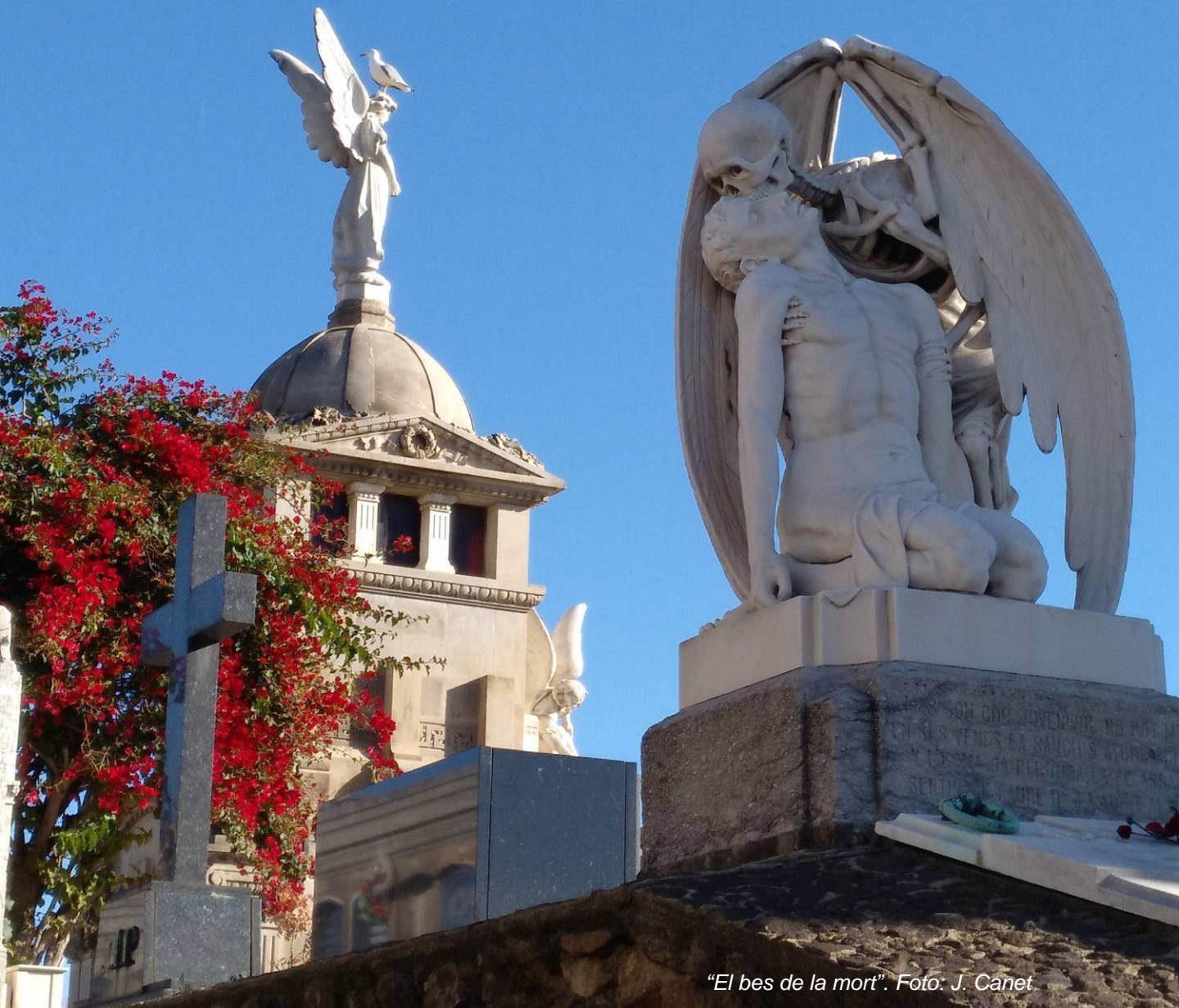
"El bes de la mort".