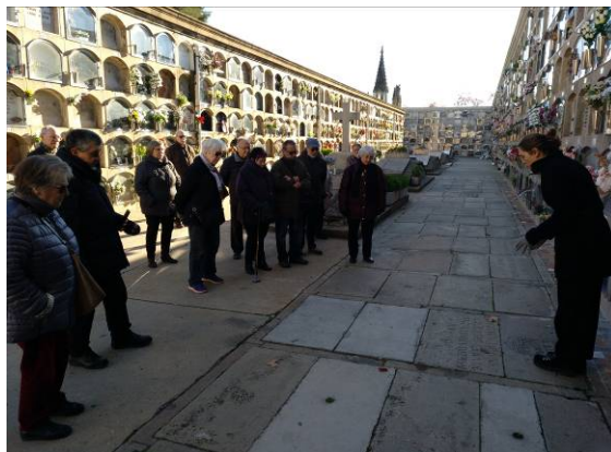
Davant la sepultura de Gabriel Bonaplata

Va acabar havent-hi tres zones ben diferenciades: la dels mausoleus (apta només per als més adinerats), la dels nínxols, i la de fosses comunes, per als més pobres.