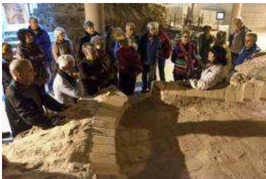
A les restes de l'antic forn del castell.

Originàriament, el Castell estava estructurat en tres plataformes. El primer nivell estava destinat a la guarnició de soldats, amb les latrines, cisternes.... A l'alçada de la porta d'accés hi havia una plataforma on s'instal·lava l'armament, amb sortida a través d'unes troneres obertes als murs. En aquest mateix nivell s'ubicava la presó i les dependències dels comandaments. A la terrassa superior hi havia l'església i d'altres estances.