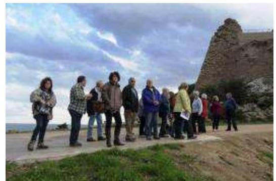
Anant cap el castell de la Trinitat.

Després de dinar a l'hora prevista la Roser ens va portar fins al Castell de la Trinitat.