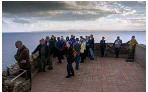
Posta de sol... intuïda.

La vista des de la terrassa és magnífica... El temps en va respectar força la visita, tan sols va caure un ruixat mentre dinàvem, però la posta de sol la vàrem haver d'intuir enmig d'uns núvols.