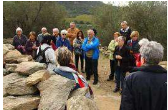
Part del grup, escoltant la guia.

Les pedres utilitzades, de considerables dimensions, sembla que varen ser extretes de la muntanya del davant.