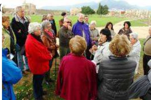
Explicacions al bell mig de la ciutadella.

El primer nivell està format per glacis i contraguàrdies units per una contraescarpa. Passat el gran fossat que l'envolta es troba el segon nivell emmurallat, amb les arestes protegides per baluards. Els cinc baluards es coneixen amb els noms de Sant Joan i Sant Jordi a l'oest, Sant Andreu al nord, i Sant Jaume i Santa Maria a l'est. La façana principal està orientada al sud i s'hi troba la porta de Mar.