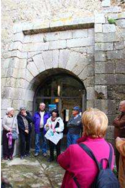
La porta d'accés al castell.

Es poden observar restes del Castell, de planta estrellada de quatre puntes, amb murs atalussats. Al sector nord-oest, cal destacar l'estructura de defensa de la porta d'accés, que forma una altra punta.