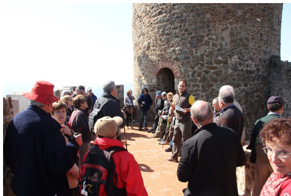
Al peu de la torre de l'homenatge.

Durant el recorregut, vam parlar de la normativa actual per la manera de fer les reconstruccions: cal diferenciar d'una manera ben evident la part reconstruïda de les restes originals. Segons algunes opinions, de vegades el contrast és massa exagerat.