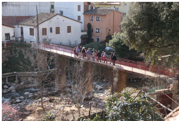
Part del grup, travessant la riera d'Arbúcies

A la una vam començar la davallada del castell. Ens vam dirigir cap Arbúcies, al restaurant La Trona, on vam menjar molt bé i molt ben servits.